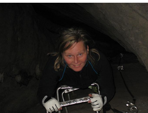
Aufstieg im Kamin